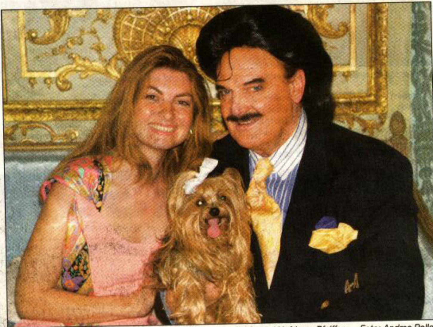
Drei, die sich gefunden haben: König Mosi, Prinzesschen Daisy und Hofdame Pfeiffer.

selbst. Jetzt sind die Hundstage. wie geht es Ihnen bei dieser Hitze? Daisy: „Bei meinem Herrchen gibt's keine Hundstage!“ - Ist es nicht lästig, wenn man überall erkannt und angeklafft wird? Daisy: „Ich finde es wunderbar.“ - Womit kann Ihr Herrchen Sie verwöhnen? Daisy: „Ich liebe es, wenn mich mein Herrchen trägt. Da bin ich ihm ganz nah und kann bei ihm kuscheln.“ - Was mögen Sie gar nicht an ihrem Herrchen? Daisy: „Das Bäuchlein meines Herrchens. Ich meine, er sollte ein bisserl ab-