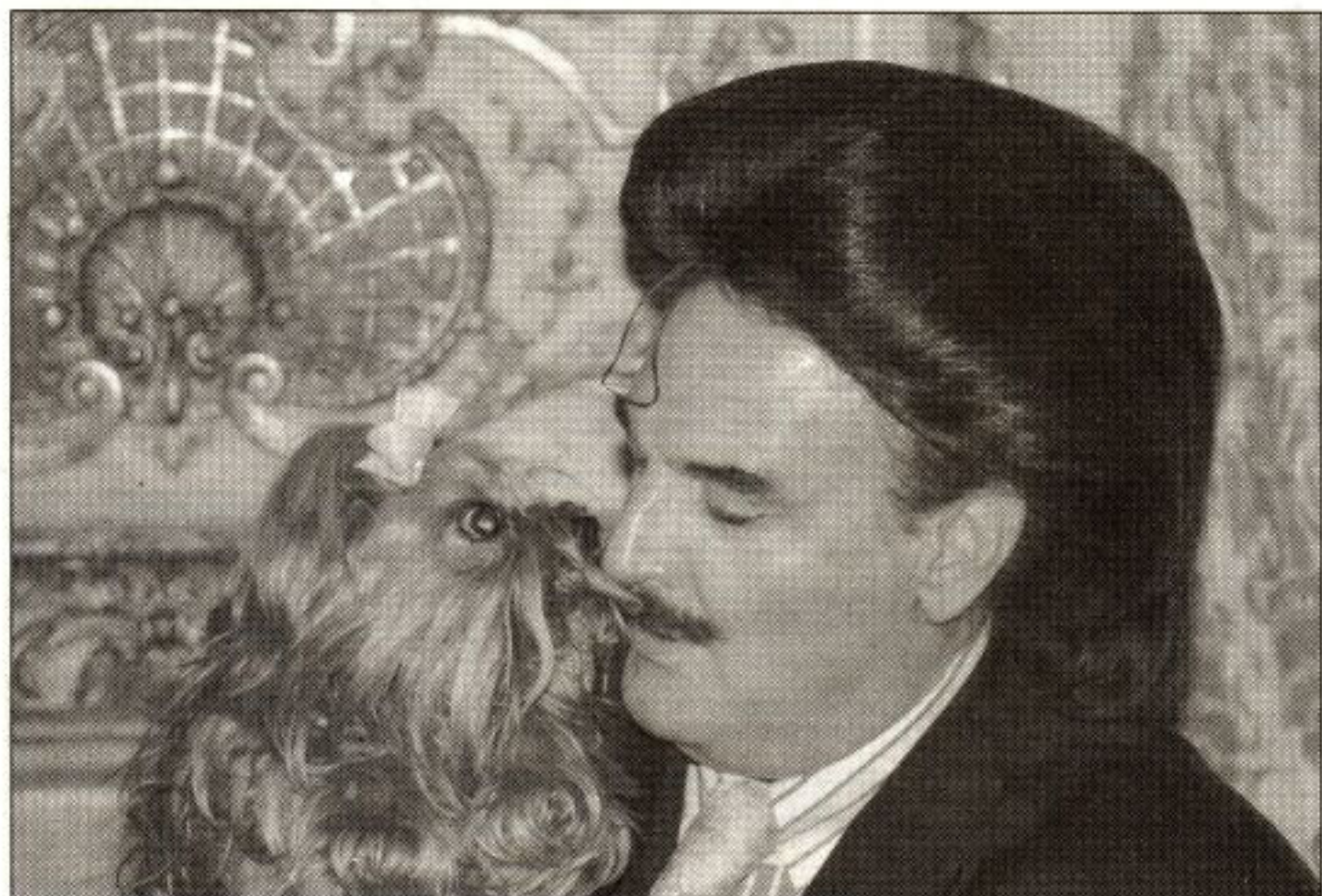
Ein Herz und eine Seele.